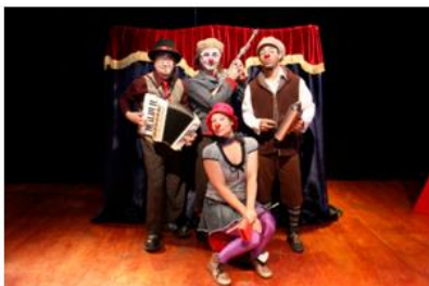
Obra "Malabares y zancadillas".

Con un estilo caricaturesco y con técnicas de clown, la compañía Reciclacirco realiza un trabajo de teatro circo infantil "de terror", donde los asistentes aprenderán divirtiéndose.