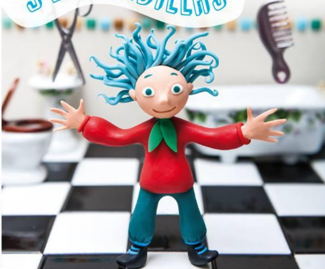
Ilustración: Cecilia Toro

RECOMENDADA PARA NIÑOS DESDE LOS 4 AÑOS.